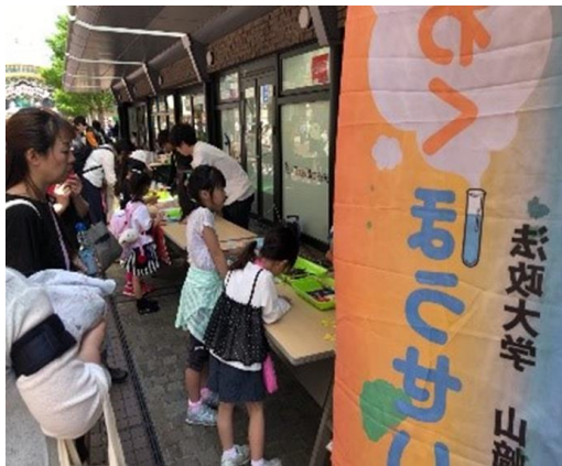
花火を咲かせようコースターづくり！