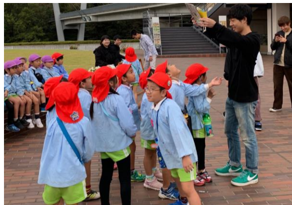
相原幼稚園のみんなを招いて多摩の自然体験