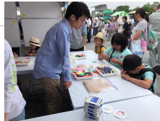
夢中で葉脈のしおり作り