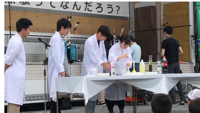
子どもたちに向けた理科実験！