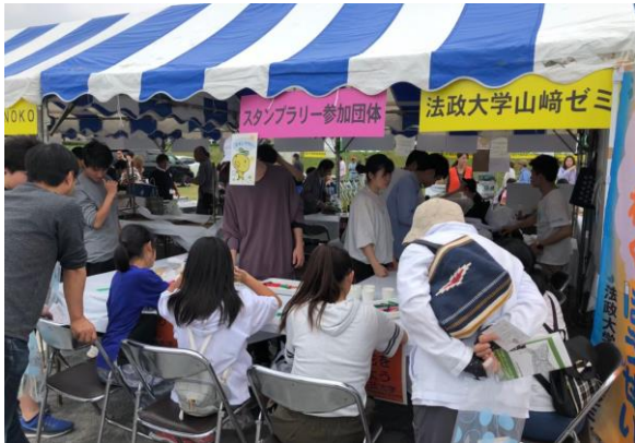
福生市環境フェスティバルの活動様子