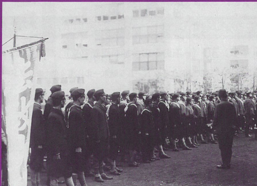
学内における壮行会(1943年10月15日)